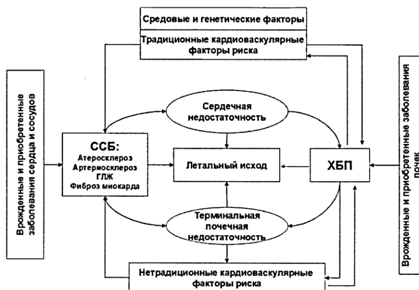
Рисунок 1. Схема кардиоренального континуума [28]

Примечание: ССБ – сердечно-сосудистая болезнь, ГЛЖ – гипертрофия левого желудочка.